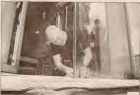
Les serruriers, dûment requis par l'huissier de justice, ont remplacé les serrures de la porte d'entrée vitrée