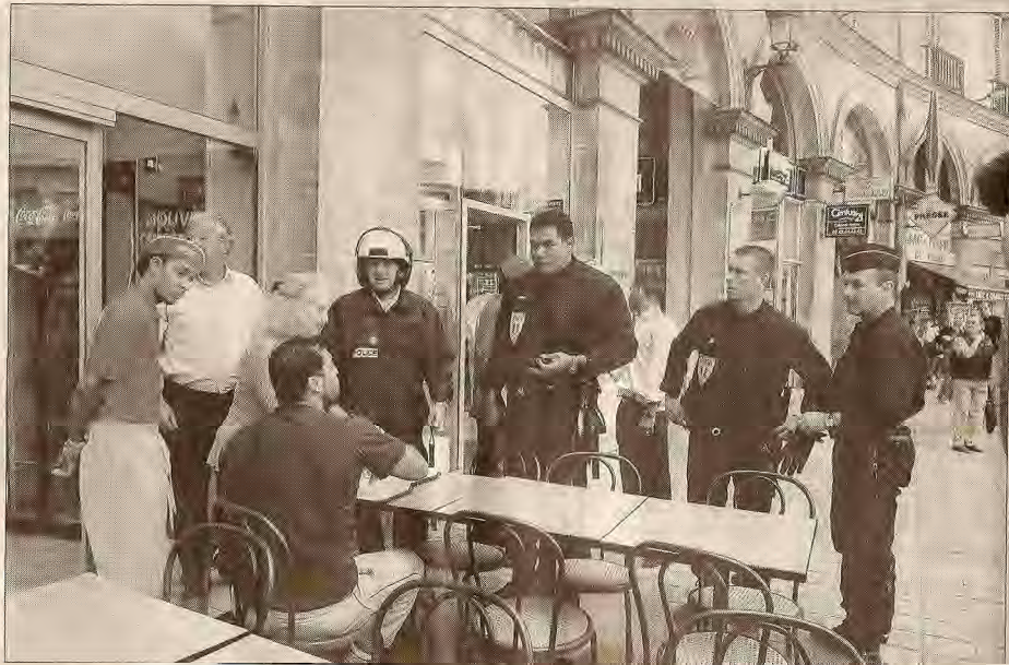
Mais la cour d'appel d'Orléans a tranché et c'est matraque à la main que les premiers policiers, des motards, se sont présentés dans le restaurant, suivis de collègues, pour faire évacuer les lieux et assurer le remplacement des serrures.

C'est ce propriétaire qui a entamé des actions en justice envers son locataire et qui a porté